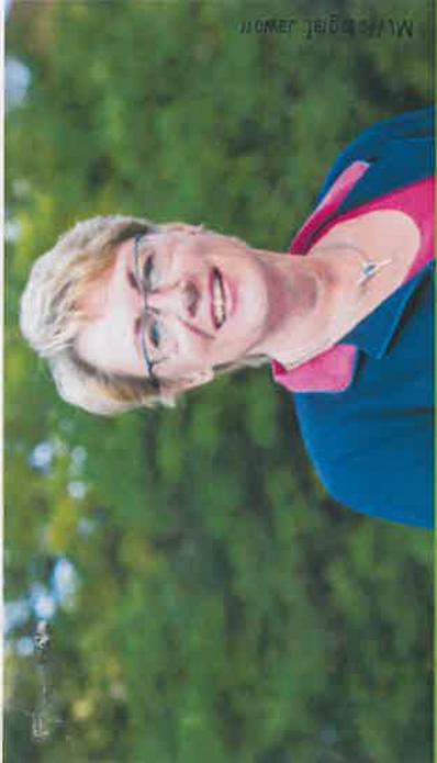
Ministerin Barbara Otte-Kinast