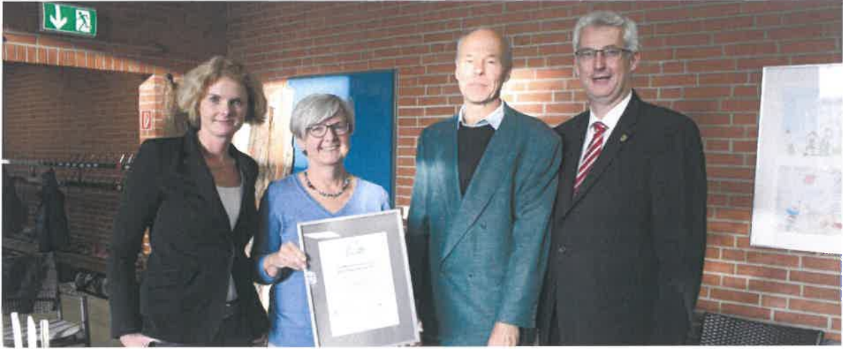
Preisübergabe im November 2017 an die Gemeinde Varrel im Landkreis Diepholz

Maßnahmen für mehr Klimaschutz und die Anpassung an den Klimawandel sind auf allen staatlichen Ebenen wichtig. Daher können niedersächsische Landkreise in der 27. Runde im Wettbewerb „Unser Dorf hat Zukunft“ einen Klimaschutz-Sonderpreis zur Auszeichnung eines engagierten Dorfes im Landkreis ausloben!